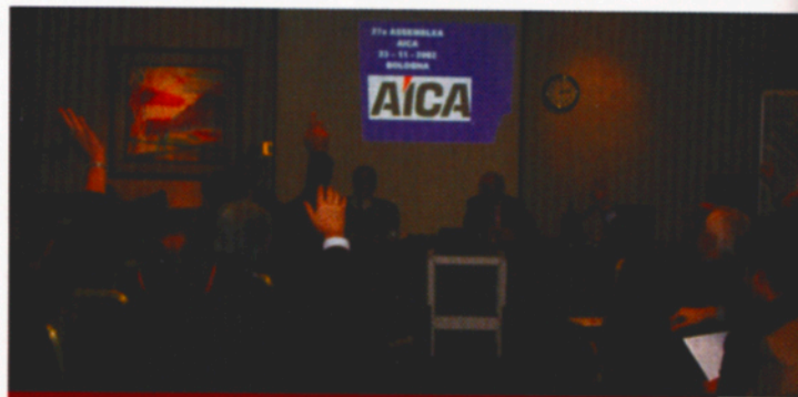
UNA MUY CONCURRIDA ASAMBLEA DE AICA, (ITALIAN ASSOCIATION OF GARAGE EQUIPMENT), QUE HOY CUENTA CON 116 EMPRESAS ASOCIADAS.